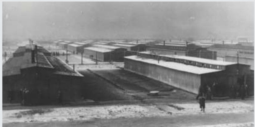
Sektor B11e: romski del taborišča v Auschwitz-Birkenau