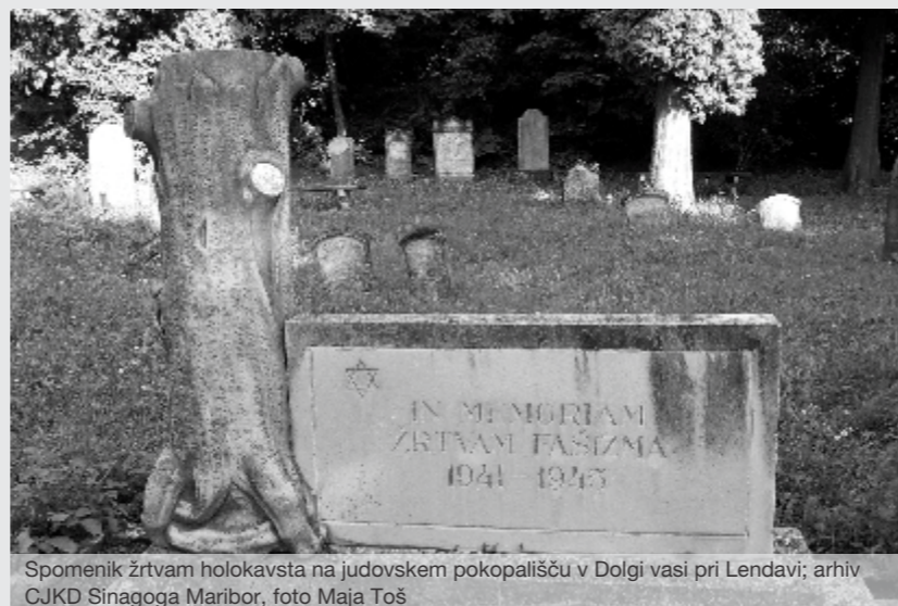
Spomenik žrtvam holokavsta na judovskem pokopališču v Dolgi vasi pri Lendavi